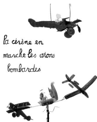
En toile de fond de l'histoire de Petit Pierre, les deux Guerres mondiales.